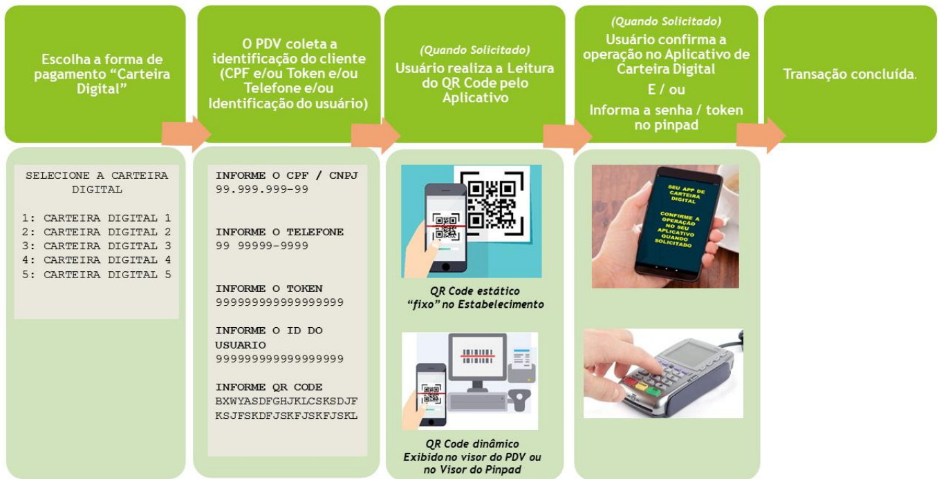
Figura 1 - Fluxo básico de uma transação com Carteira Digital

Em geral, o fluxo de uma transação com Carteira Digital é bem simples, podendo variar de acordo com cada Carteira Digital.